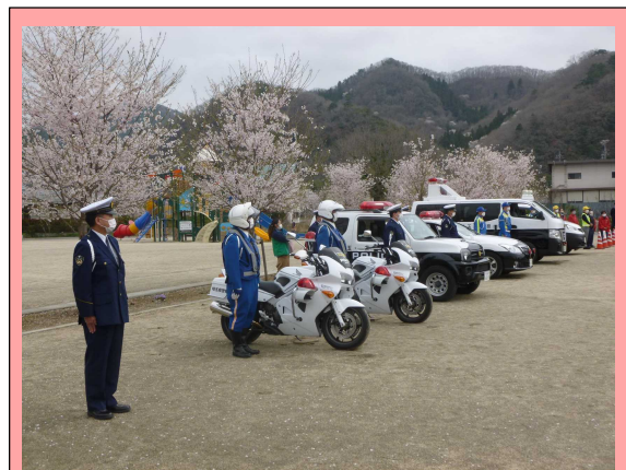
春の出発式の様子(長瀬はつらつパーク)

内容 秩父市長・秩父警察署長・秩父交通安全協会会長・埼玉県交通安全母の会連合会会長あいさつ 埼玉県交通安全メッセージを市長に伝達 秩父屋台囃子演奏 警察車両出発報告 ※雨天中止